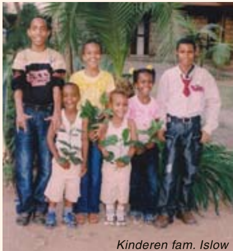
Kinderen fam. Islow

Niet zo lang geleden ontmoetten we een man uit Kenia, die hier in Nederland tot bekering is gekomen. Hij heeft ingezien dat hij met een leugen Nederland is binnengekomen en heeft dat ruiterslijk toegegeven aan de autoriteiten. Dat leidde