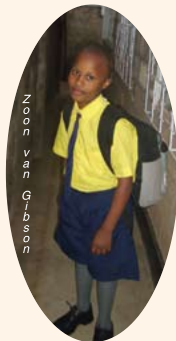
Zoon van Gibson

Het is in Kenia compleet anders dan in ons land. Laten we hopen dat het vertrek uit Kenia niet al te lang op zich laat wachten.