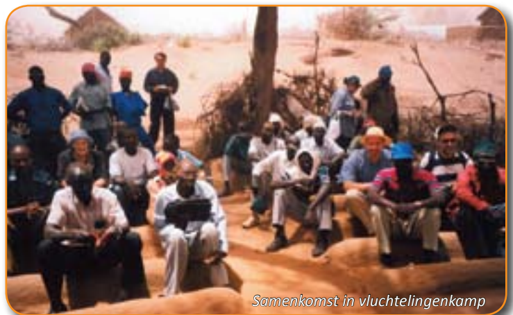
Samenkomst in vluchtelingenkamp