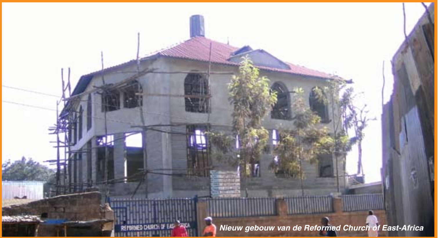
Nieuw gebouw van de Reformed Church of East-Africa

MEI 2012 verschijnt minstens 4 x per jaar