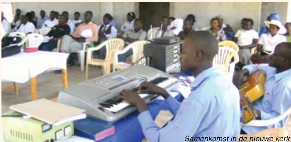
Samenkomst in de nieuwe kerk