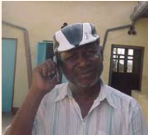
Christian Fellowship in Kakuma...

Regelmatig krijgen we een verslag toegezonden van mensen die werken bij Trans World Radio in Nairobi.