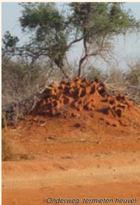
Onderweg: termieten heuvel

Hier in het rijke Westen kunnen we ons nauwelijks een beeld vormen hoe de werkelijke situatie is voor deze medeaardbewoners. Hoe op sociaal, emotioneel en geestelijk vlak er alles aan mankeert. Dat levens metterdaad door elkaar zijn geschud.