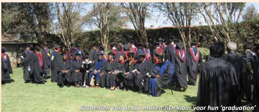
Studenten van de ILU maken zich klaar voor hun 'graduation'

Na het afronden van zijn eerste studie aan