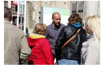
Jaco in Actie - Brussel

Enkele jaren achtereenvolgend hebben we de Barnabasactie in Brussel uitgevoerd. Juist in Anderlecht, grenzend aan de wijk Molenbeek, zijn onze Barnabasevangelisten recent actief geweest. Helaas was de belangstelling en support vanuit onze achterban minimaal. En van slechts enkele Belgische vrienden kregen we support. Vooral de Spaanstalige gemeente stond ons krachtig bij. Wat jammer dat vooral mede om die reden de actie dit jaar 2015 daar niet is doorgedaan. Maar bij het volgen van het Nieuws over de terreuraanslagen komt de zendingskriebel weer omhoog. Tekent u vast in voor volgend jaar 2016.