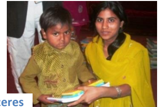
Kind met Onderwijzeres