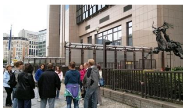
Bidden voor Europees Parlement

Overheden en regeringsleiders verklaren de oorlog aan IS maar wij willen met onze zendingsvrienden proclameren: Jesus heeft de zondaars lief en daar horen IS terroristen bij. Alleen de liefde macht van Jezus krijgt terroristen op de knieën. Wij verklaren de oorlog vooral aan de onbekendheid met het Reddend Evangelie, en zoals Paulus zegt: aan de machten en overheden in de lucht! En dat terwijl hij nog niets wist van radio en media! Ter verduidelijking: We leven in een maatschappij die door en door verrot is van top tot teen door materialisme en genotzucht. Media en Internet zijn ervan doordrenkt!