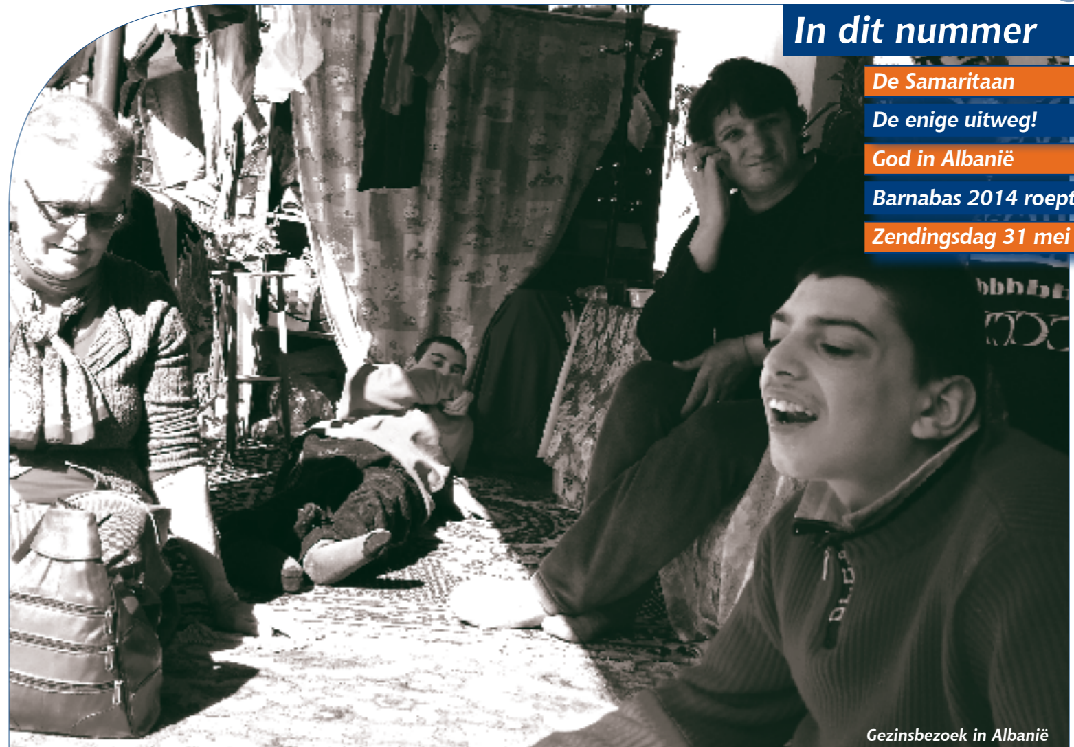
Gezinsbezoek in Albanië