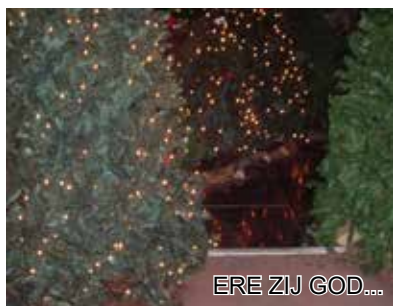
ERE ZIJ GOD...

Op 25 November is in de GROENE WEG winkel in ons hoofdkantoor Krimpen aan de Lek - Tiendweg 9 (Nederland) de kerstmarkt van start gegaan. In het kerkelijk jaar start dan ook de adventstijd. We bevinden ons nu in de zogenoemde donkere dagen voor Kerst. We bereiden ons voor op de Kerstvieringen. Met alle versieringen buiten en in de winkel, komen we al langzaam in de feeststeren. Onze tweedehands winkel De Groene Weg is eigenlijk het hele jaar door een bijzondere plek om een nuttig gebruiks-voorwerp, nog heel goede, soms bijna nieuwe kleding te vinden, of een goed boek. Niet te vergeten ook een noodzakelijk of decoratief meubelstuk. Een plek die door wijlen zuster Groeneweg ook is gewijd aan de hulp voor de armen. Een aantrekkelijke manier om iets moois aan te schaffen en tegelijk onze projecten te sponsoren. Hartelijk welkom in onze Groene Weg winkel! En wie nood heeft kan ook terecht voor een goed gesprek en gebed.