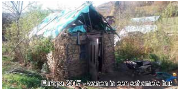
Europa 2017 - wonen in een schamele hut

In oktober zijn er in Roemenië en Servië heel wat gezinnen bezocht. De armoede lijkt uitzichtloos, maar als het evangelie klinkt lichten er ogen op en verschijnt er een brede glimlach. De bemoediging van het evangelie geeft hoop en kracht in de moeilijkste omstandigheden. Met name het bezoek aan Cristina met haar kindjes in een schamele hut maakte indruk. Het is ons gebed dat er spoedig verbetering mag komen voor hen. Twee jonge meisjes die met hun broer en vader in Servië wonen maakten diepe indruk. In en rond het huis was een enorme ravage. Sinds moeder is weggelopen kan vader de zorg niet aan. Maar de kinderen hebben hun hoop op God gevestigd en stralen daar midden in deze duistere situatie.