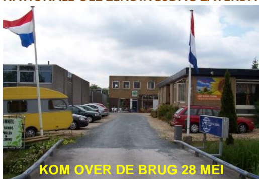
KOM OVER DE BRUG 28 MEI