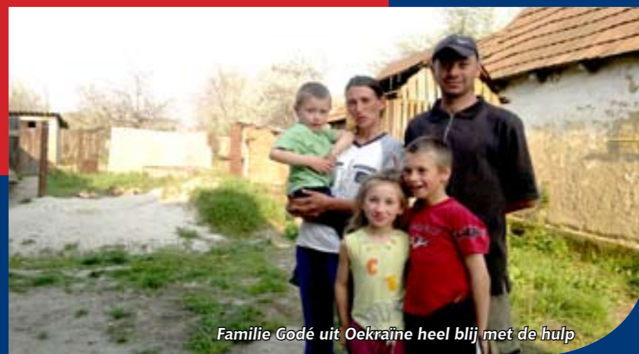
Familie Godé uit Oekraïne heel blij met de hulp

Reisverslag Oekraïne – Jaco van der Sterre