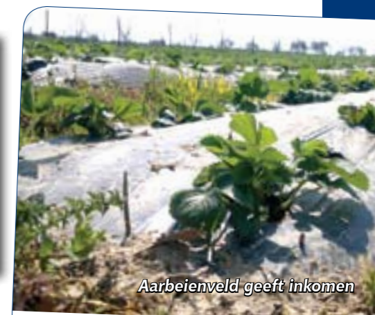
Aarbeieveld geeft inkomen

Uw giften zijn welkom op ING 58.56.826 t.n.v. Hulpfondsen OostEuropa Zending o.v.v. Oekraïnehulp