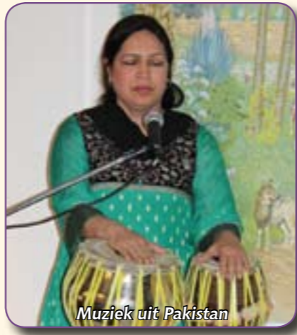
Muziek uit Pakistan

Uw speciale bijdragen welkom op ING 3223996 OostEuropa Zending of ING 5856826 OostEuropa Zending Hulpfondsen, beide te Rotterdam