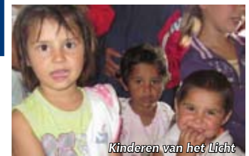
Kinderen van het Licht

Dankzij collectes uit de drie Rhoonse kerken, de gesponsorde bijdragen en hulp via de TweedekansWinkel is het mogelijk geweest een aantal noden te lenigen. Zoals bijv. huurachterstand, medische behandeling, geld voor water, energie en andere basisbehoeften. We brachten voedselpakketten, speelgoed en warme kleding voor de aanhoudende koude. Ook deze keer is het weer gelukt mensen in Roemenie te helpen, waaronder ook de medewerkers van Casa Lumina die wij mochten stimuleren.