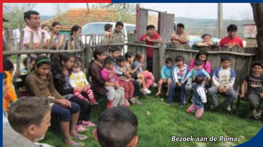
Bezoek aan de Roma

Een redactioneel bewerkt verslag van Carla Hendriks