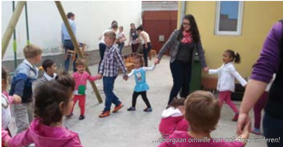
...doorgaan omwille van ook deze kinderen!

Het is alweer bijna 18 jaar geleden dat God mij riep om naar Oradea te gaan om onder straatjongeren te werken. Wat is er veel gebeurd in al die jaren. Persoonlijk heb ik veel geleerd van de tijd die God me daar bevestigde. Straatjongeren hebben een eigen cultuur die ik met mijn Nederlandse cultuur nauwelijks of niet kon doorgronden. Enkelens belandden regelmatig in de