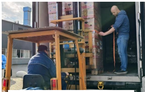
Laden hulptransport in Krimpen ad Lek

Door een bijzondere schenking van veel medische hulpgoederen kunnen we nu voor dit najaar zeker 4 trailers vullen voor transporten naar Oost-Europa om de armen en oorlogsslachtoffers een zegen te brengen. De goederen zijn dan wel geschonken, maar voor de organisatie van één en ander zijn uw gifte en bijdragen hard nodig. HELP ons HELPEN! 06-53883103