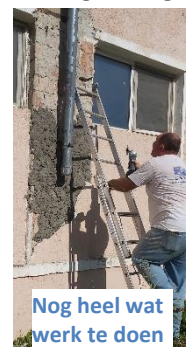
Nog heel wat werk te doen

Ook voor zending in Roemenië en Oekraïne zijn steeds mensen nodig! Geef u op!