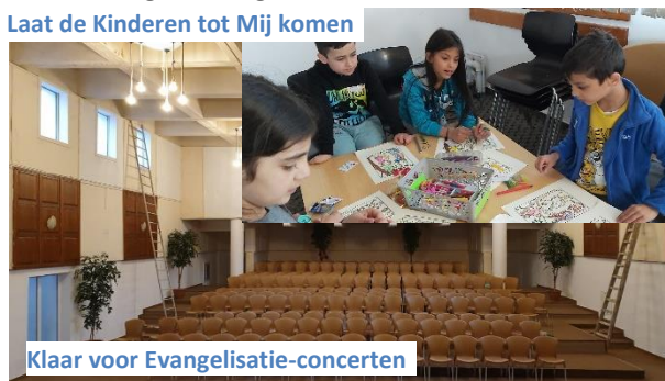
Klaar voor Evangelisatie-concerten