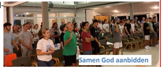
Samen God aanbidden