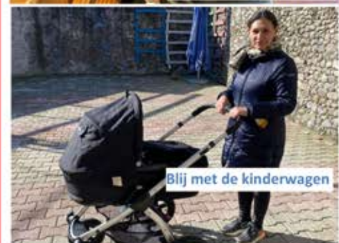
Blij met de kinderwagen