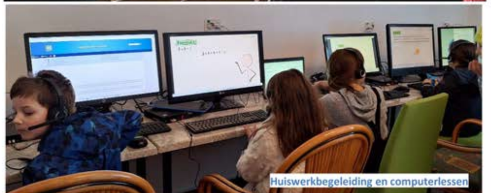
Huiswerkbegeleiding en computerlessen