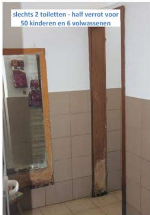
slechts 2 toiletten - half verrot voor 50 kinderen en 6 volwassenen

de meeste van de 50 kinderen uit de Roma gemeenschap komen. De allerarmste en meest achtergestelde groep in de maatschappij. De kinderen komen van 8.00 uur tot 12.00 uur en krijgen geen eten, drinken of fruit, maar alleen wat onderwijs via tv. De leraren deden hun best om hen wat liedjes of rijmpjes te leren. We begonnen speelgoed te brengen samen met met partner Hart voor Albanië . Ook regelden we voor elk kind een stuk fruit per dag. Nu wordt ons gevraagd hier te helpen met de renovatie van de toiletten, die gebruikt worden door 50 kinderen maar ook zes personeelsleden. Daar is een bedrag van 3000 euro mee gemoeid. Help ons alstublieft met uw donaties om de renovatie van deze kleuterschool te laten slagen.