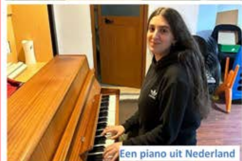
Een piano uit Nederland