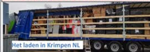
Het laden in Krimpen NL