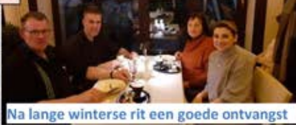
Na lange winterse rit een goede ontvangst