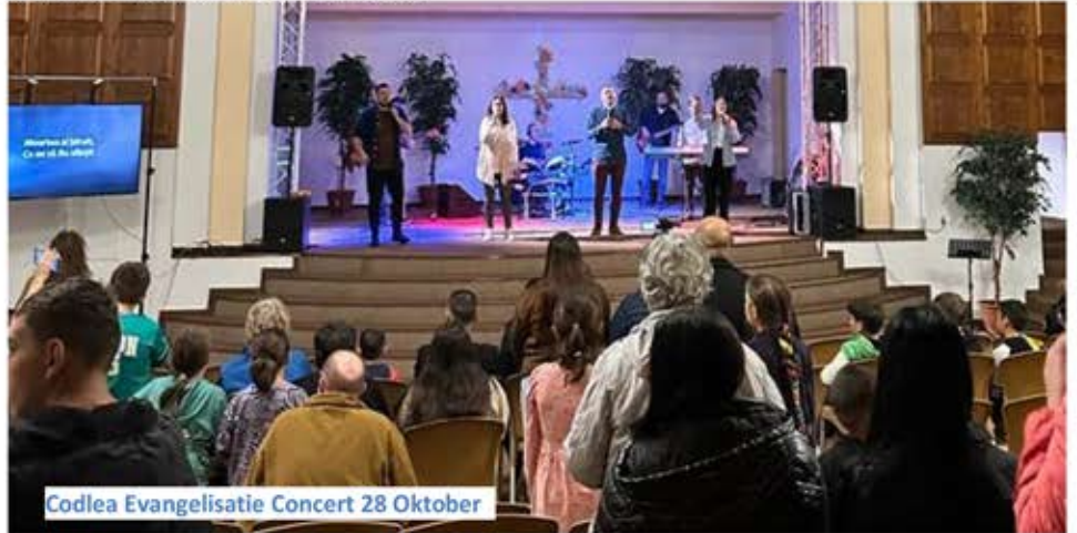
Codlea Evangelisatie Concert 28 Oktober

Wij hebben weer veel redenen om God te danken! 28 Oktober was het eerste concert, met daarna een korte boodschap. Het was een enorme klus om alles voor te bereiden, maar met hulp van vrienden is het allemaal gelukt. Wij hadden een enquête uitgedeeld en de reacties van de aanwezigen waren positief. Nieuwe Testamenten konden mensen gratis meenemen. Een jonge moeder was in tranen en vertelde dat zij Gods Liefde en vrede mocht ervaren. Ze heeft drie kinderen en gaat door een moeilijke tijd, omdat haar man in de gevangenis zit. Ze was ontzettend bemoedigd en wil graag uitgenodigd worden voor komende activiteiten.