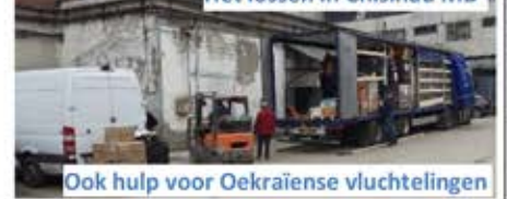
Het lossen in Chisinau MD