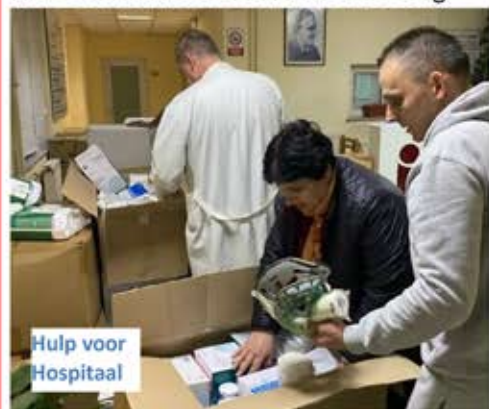
Hulp voor Hospitaal

4 à 5 keer per jaar ontvangen wij goederen in Albanië, via de vrachtwagen van Hoop voor Albanië, vanuit Krimpen (OEZ). Het gaat om: medische goederen, bedden en matrassen, keukenapparatuur, speelgoed voor kinderen, schoolmaterialen, wasmiddelen, stoelen, banken enz. Waaraan door de armoede grote behoefte is. Zo krijgt het Evangelie ook betere toegang doordat het niet bij woorden blijft maar daden toont van Gods liefde en voortdurende zorg.